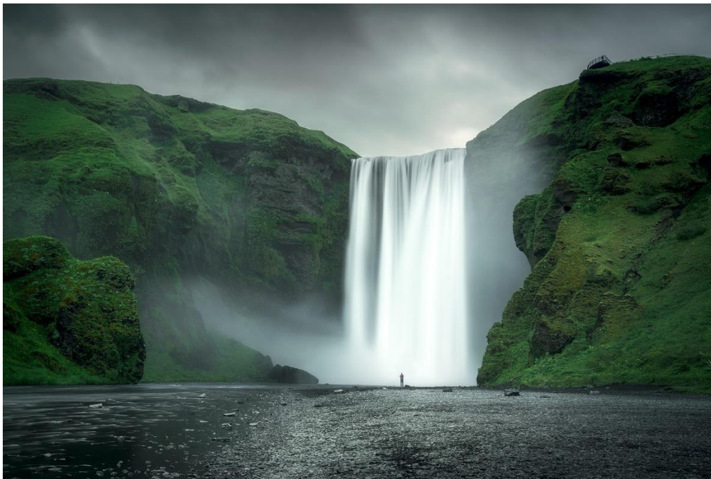
Cascade de Skogafoss

Jour 9 : Dimanche C'est la matinée « joker » ! J'inclus toujours une demi-journée au minimum dans mes voyages afin d'avoir la possibilité de revenir sur un spot que le groupe aura le plus apprécié (au sud), ou en cas de mauvais temps, cela permet d'avoir une seconde chance.