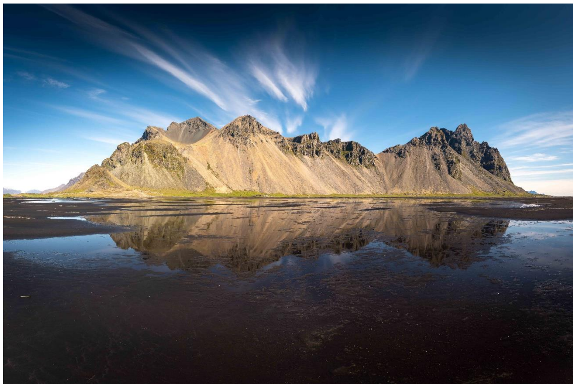
Plage de Stokksnes

Prévoir un équipement de type « oignons » (Multi-couches)