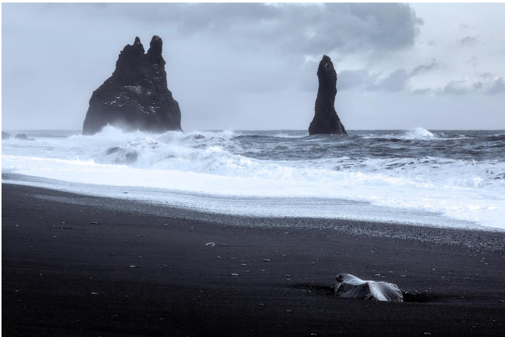
Plage de Vik

L'après-midi aura 3 gros temps forts avec la plage de Vik, les cascades de Seljalandsfoss et de Skogafoss.